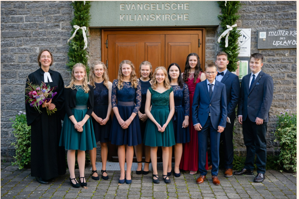
Oben die Konfirmierten, unten die neuen Konfirmandinnen und Konfirmanden.