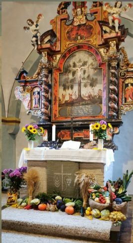
Erntedank in Usseln